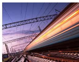
运输系统 铁路接触网检查