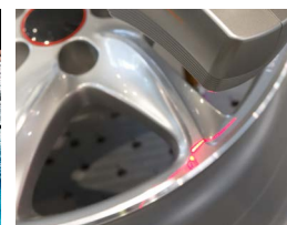
汽车工业 3D 表面检查