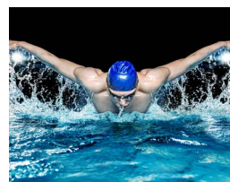
运动 分析游泳动作正确与否